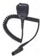
PMMN4067 IMPRES™ リモートスピーカーマイク