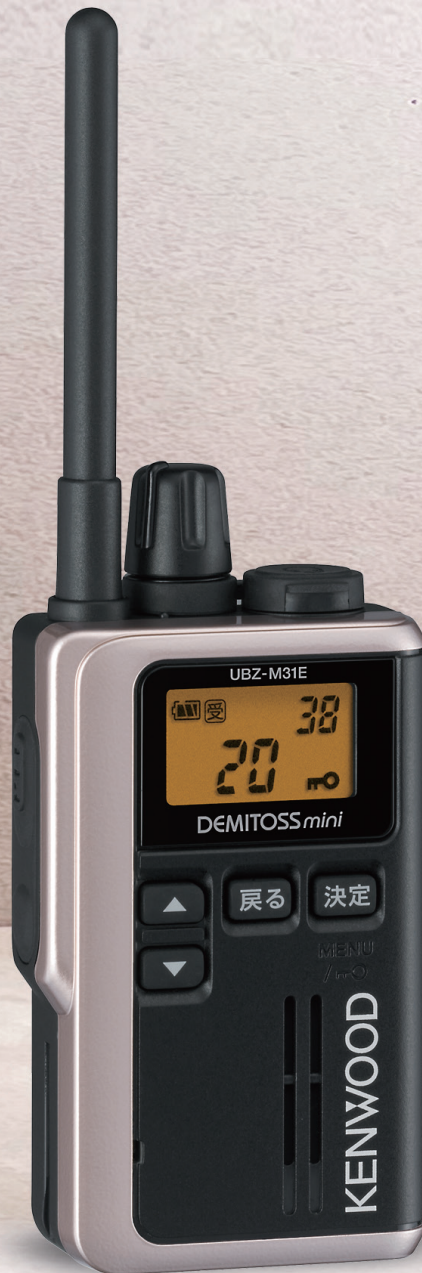
《実物大》 UBZ-M31E G