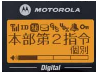
〈ディスプレイ:実物大〉

世界各国で政府機関向けの無線機を供給し、高い評価を得ているモトローラだからこそできる製品(本体)2年保証です。