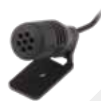
サンバイザーマイク* GMMN4065

*印のアクセサリを使用する際には、データ通信ケーブル(CT-147)が必要です。