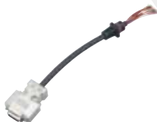
データ通信ケーブル CT-147