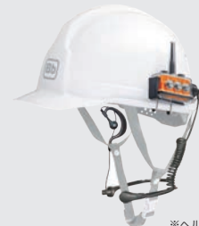
※ヘルメットは付属しません。