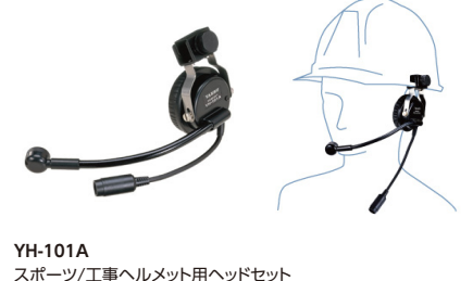
YH-101A スポーツ/工事ヘルメット用ヘッドセット 標準価格15,540円(本体価格14,800円)

ヘルメットに装着するタイプのヘッドセット ※本体との接続にはCT-87が必要です。