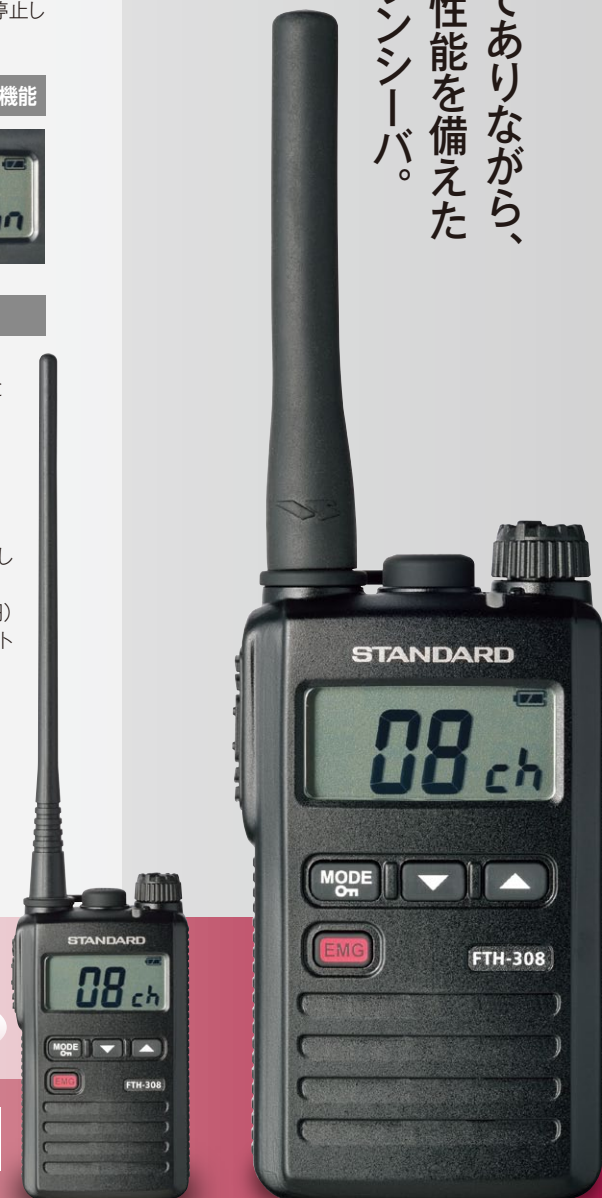
FTH-308L(高利得アンテナモデル)

小型・軽量ボディでありながら、優れた防塵・防水性能を備えた頑丈かんたんトランシーバ。