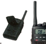
SHC-15 キャリングケース 標準価格1,995円(本体価格1,900円)