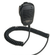
MH-57A4B スピーカーマイク 標準価格4,935円(本体価格4,700円)