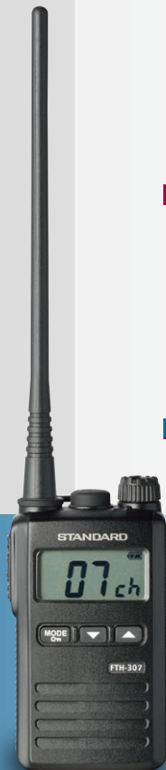
FTH-307L(高利得アンテナモデル)