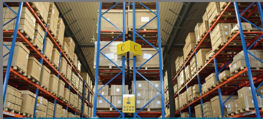
倉庫 中継器対応で、広範囲での使用も可能