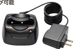
VAC-61 急速充電器セット 標準価格2,625円(本体価格2,500円)