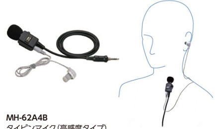
MH-62A4B タイプイヤホン (高感度タイプ) 標準価格6,825円(本体価格6,500円)