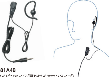
MH-381A4B 小型タイプイヤホン 標準価格3,990円(本体価格3,800円)