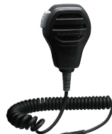
MH-73A4B 防浸型スピーカーマイク 標準価格5,460円(本体価格5,200円)