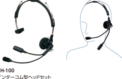
YH-100 インターコム型ヘッドセット 標準価格5,534円(本体価格5,270円)

ヘルメットに装着するタイプのヘッドセット ※本体との接続にはCT-87が必要です。