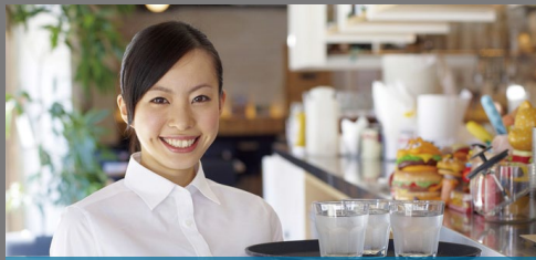
レストラン 女性スタッフでも手軽に使えるサイズと重量