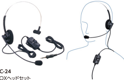
VC-24 VOXヘッドセット 標準価格8,400円(本体価格8,000円)