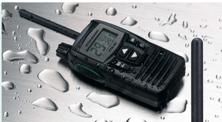
水を扱う現場や突然の雨にも対応する ワンランク上の防水性(IPX5)