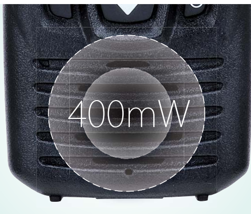
屋外や騒音下でもクリアな音声を伝える 400mW大音量スピーカー