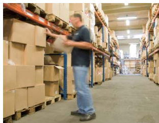
倉庫での配送指示