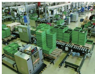
工場での連携・進捗管理