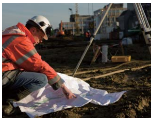
建設・工事現場での業務連絡