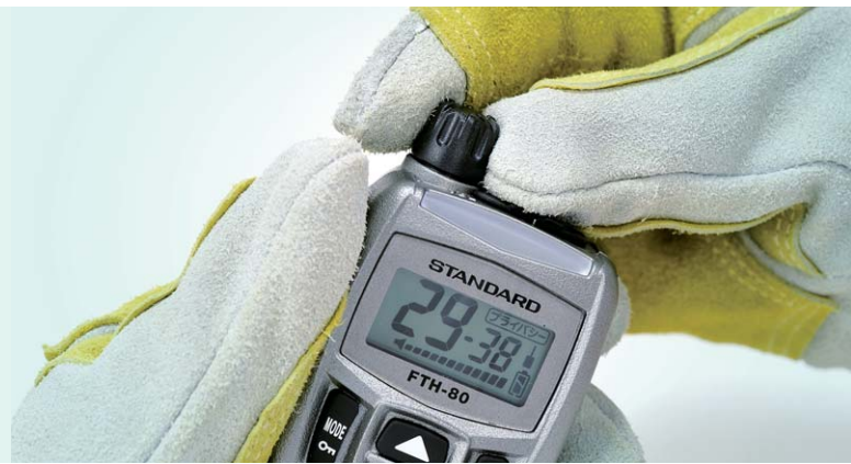
送受信の状態がひと目でわかる大型LEDインジケータ 大型ディスプレイは、チャンネルや音量を常に表示