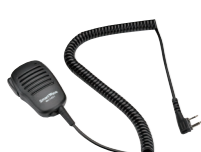
スピーカーマイク SK-M01 (スピーカー出力 0.5W 3.5φイヤホン端子付き)

※運転中のイヤホン、ヘッドホンの装着は各都道府県の条例で規制されている場合があります。