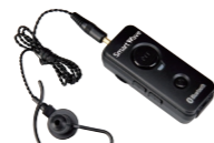
Bluetooth® イヤホンマイク SK-M03