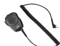
大音量防水スピーカーマイク MP68 (IP67*相当 防水・防塵性能、 スピーカー出力2W 3.5φイヤホン端子付き)