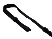
ネック ストラップ SK-T03