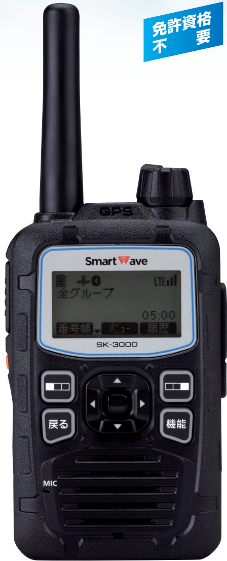
実寸大 重量 約250g (アンテナ、Li-ionバッテリーパック装着時)