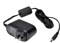
急速充電器用ACアダプタ SK-P03