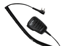
防水スピーカーマイク SK-M04 (IP67*相当防水・防塵性能 スピーカー出力 0.5W)