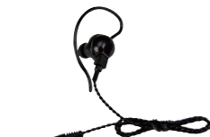
スピーカーマイク用 イヤホン SK-E01 (ケーブル長 約0.5m)