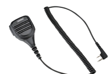
大音量スピーカーマイク MP16 (IP54*相当 防水・防塵性能、 スピーカー出力2W 3.5φイヤホン端子付き)