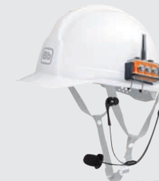
※ヘルメットは付属しません。